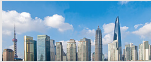
Level 15 & 16 Nexus Building 41 Connaught Road Central 999077 Hongkong