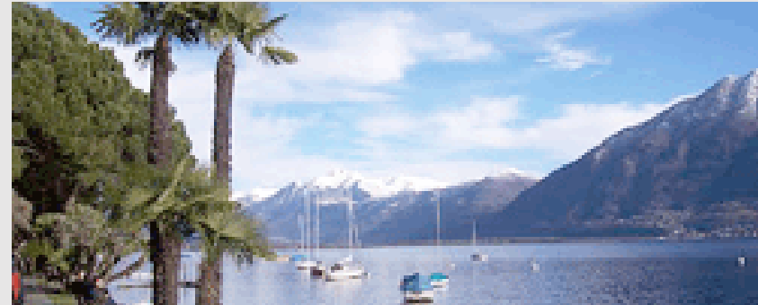
Vic. Ponte Vecchio 3-5 6600 Locarno