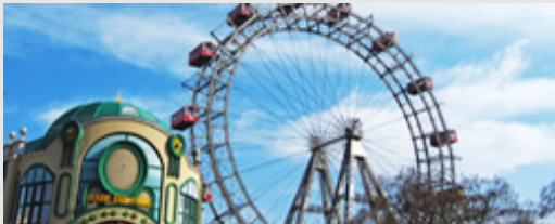
Kärntner Ring 5-7 1010 Wien